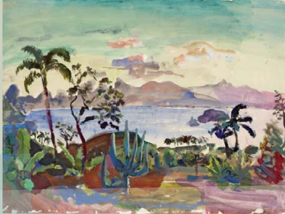
Guanabara-Bucht mit Zuckerhut. 1934. Deckfarbe (Titelbild)