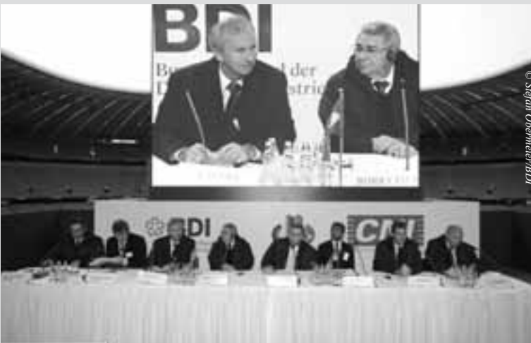
brasilianischen Regierungs- und Unternehmensvertretern endete