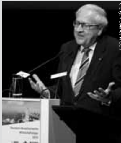
Bundeswirtschaftsminister Rainer Brüderle