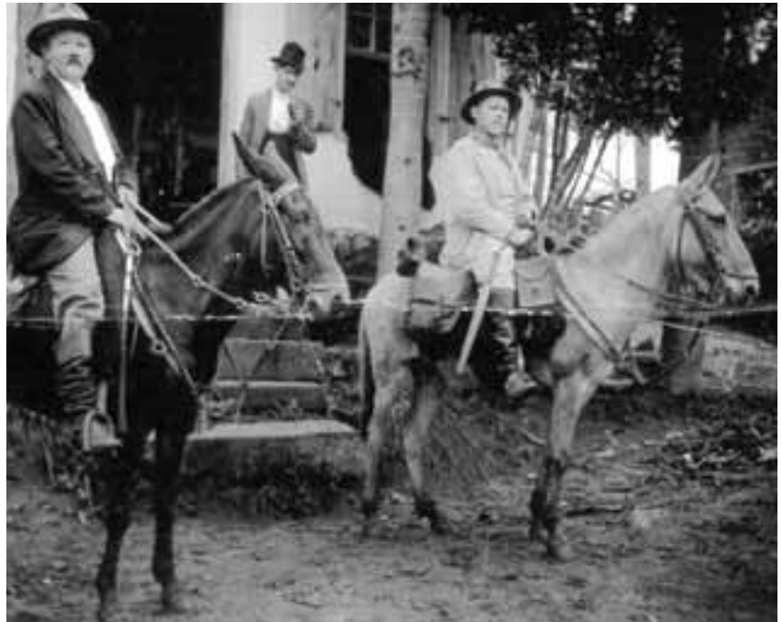
"Musterreiter" (mobile Verkäufer) um 1900 in Novo Hamburgo

Café, Morro Reuter, Nova Petrópolis, São Leopoldo und seine Heimatstadt Novo Hamburgo.