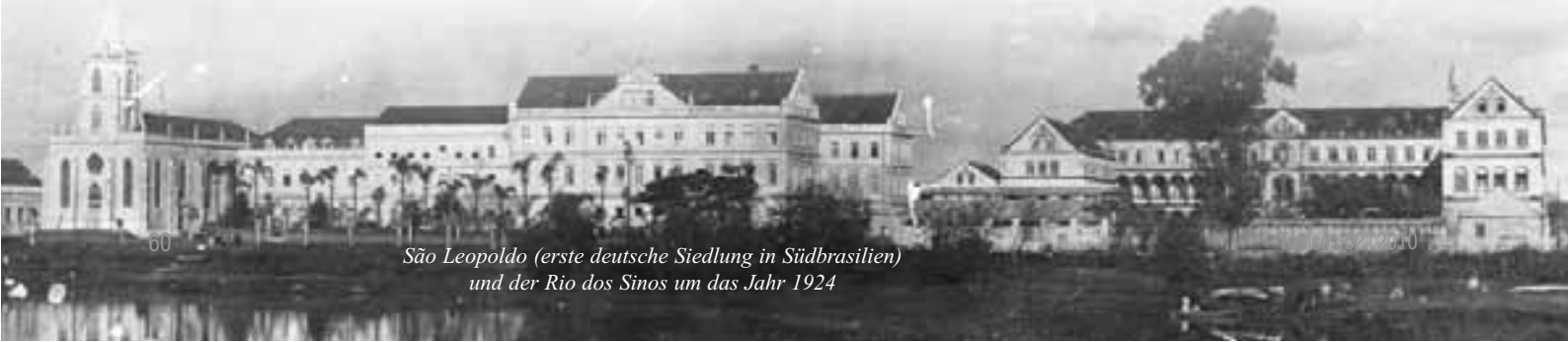
São Leopoldo (erste deutsche Siedlung in Südbrasilien) und der Rio dos Sinos um das Jahr 1924