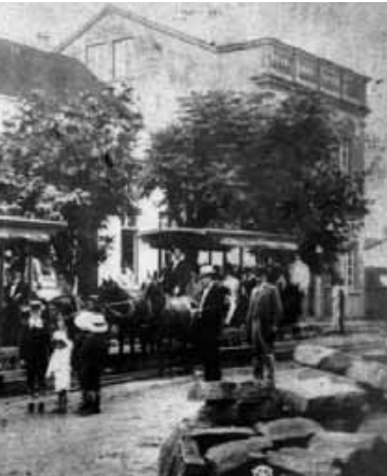
Öffentliche Verkehrsmittel in Novo Hamburgo im Jahr 1913