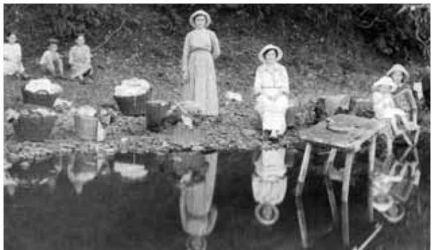
„Wäscherei“ am Rio Cai, Gemeinde Feliz um 1935

Seit 2009 konzentriert Braun sich auf die Sammlung, Restaurierung, Katalogisierung und Digitalisierung alter Fotos der deutschen Immigration. Inzwischen ist sein Archiv auf über 8.000 Bilder angewachsen, die den Zeitraum von