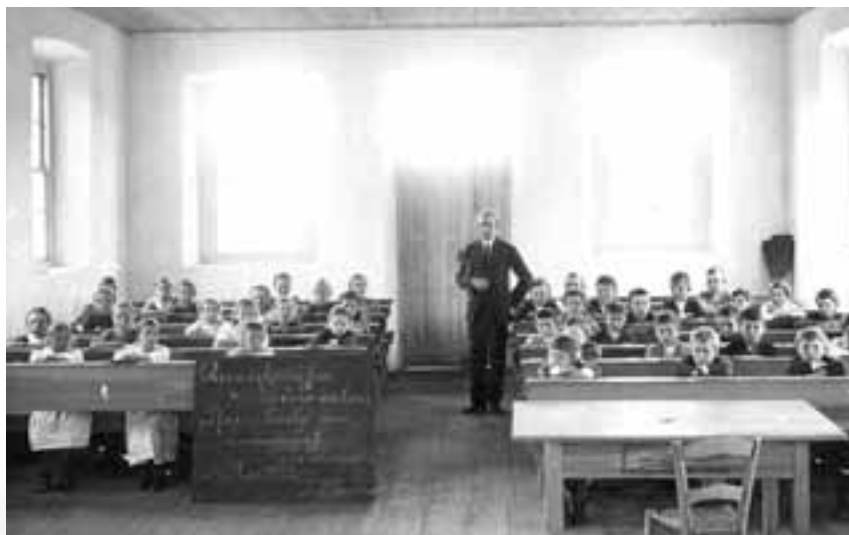
Deutsche Schulklasse in Linha Imperial, Nova Petrópolis (1922)

Braun begann seine Recherche 2001 in Bom Princípio, einer Gemeinde mit rund 11.000 Einwohnern nördlich von Porto Alegre, die von Deutschen gegründet wurde. Weitere Stationen seiner Recherche waren die Gemeinden Feliz, Salvador do Sul, Montenegro, Pareci, Harmonia, Ivoti, Dois Irmãos, São José do Hortêncio, Picada