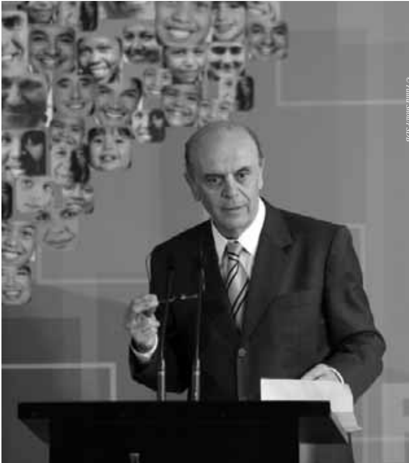
Mit Serra präsentiert die Opposition einen erfahrenen Politiker als Kandidat

begegnen. Einerseits verweist er auf politische Fakten wie den Beginn dieser Programme in der Regierung Cardoso, an der er selbst als Gesundheitsminister beteiligt war sowie auf die Sozialprogramme seiner eigenen Regierung in São Paulo. Als Gesundheitsminister setzte er den Gebrauch von billigen Generika-Medikamenten in Brasilien und auch in der WTO durch.