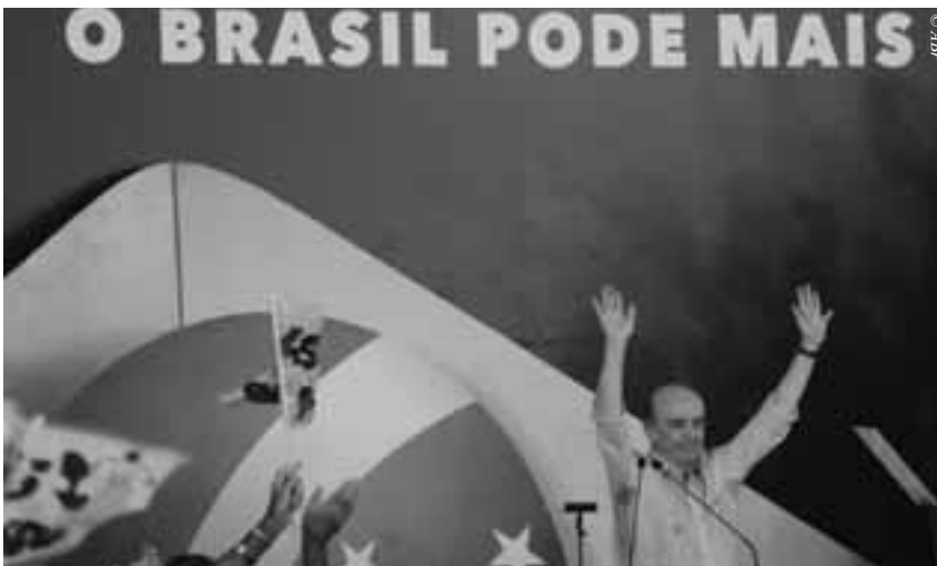
Kandidat Serra: "Brasilien kann mehr"

Wahlkampfstrategisch stellt sich hier die größte Herausforderung für Serra: Heute empfangen 11-12 Millionen Familien in Brasilien direkte Zahlungen aus „Bolsa Família“, die eine immense Wählerschaft repräsentieren. Serra will dem Vorwurf, er werde eine „neoliberale“ Politik betreiben, die das Ende dieser Programme bedeute, durch zweierlei