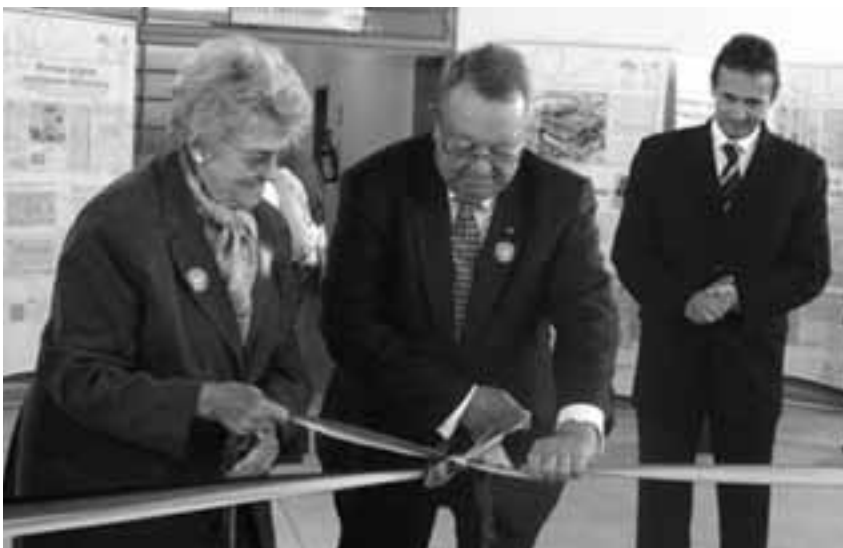
Eröffnung der Ausstellung

Erst ab 1850, die Stadt São Paulo wurde als Handelsplatz für Kaffee und als Durchgangsstation zum Hinterland immer wichtiger, siedelten sich in dieser schnell wachsenden Metropole weitere deutsche Einwanderer an.