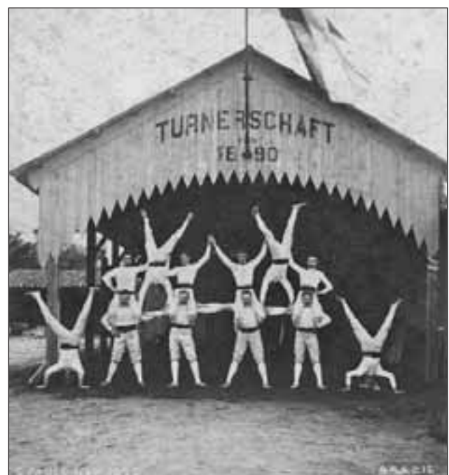
Turnerschaft von 1890 - São Paulo -