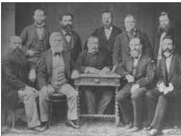
Gründer der Deutschen Schule