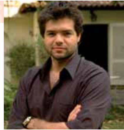
Vingança | Retribution | Rache, Land: BRA 2008, Bildbeschreibung: Paulo Pons, Sektion: Panorama

ge, was Garapa im Gegensatz zu Vidas Secas an tatsächlich Neuem bringt. Garapa bereitet das Thema Hunger in einer fast archaischen Reise anhand humaner Fundstücke mit Seltenheitswert sensationell auf. Padilhas Kamera fehlt zuweilen der Respekt, denn er leuchtet die Menschen bis hin zum Zehnnagel, Allergiepusteln und Zahnlücken aus, durchleuchtet Körper und Lebensumfeld. Die Not der Menschen, die vom brasi-