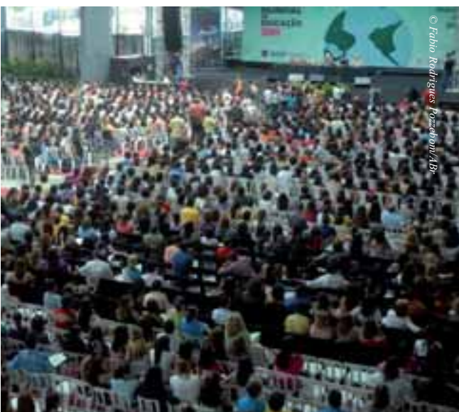
Mesa de debate no Fórum Mundial de Educação, realizado paralelamente ao FSM