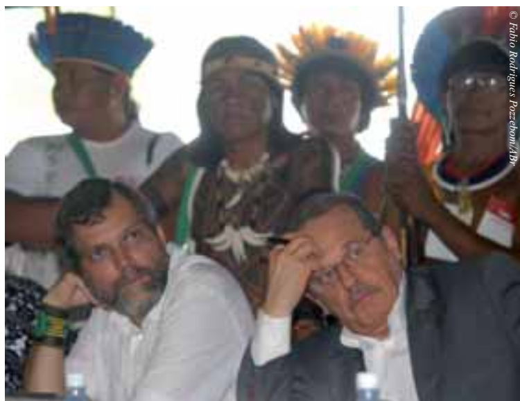
Belém - Ministro da Justiça, Tarso Genro, e o presidente da Funai, Márcio Meira, durante reunião com grupos indígenas no FSM