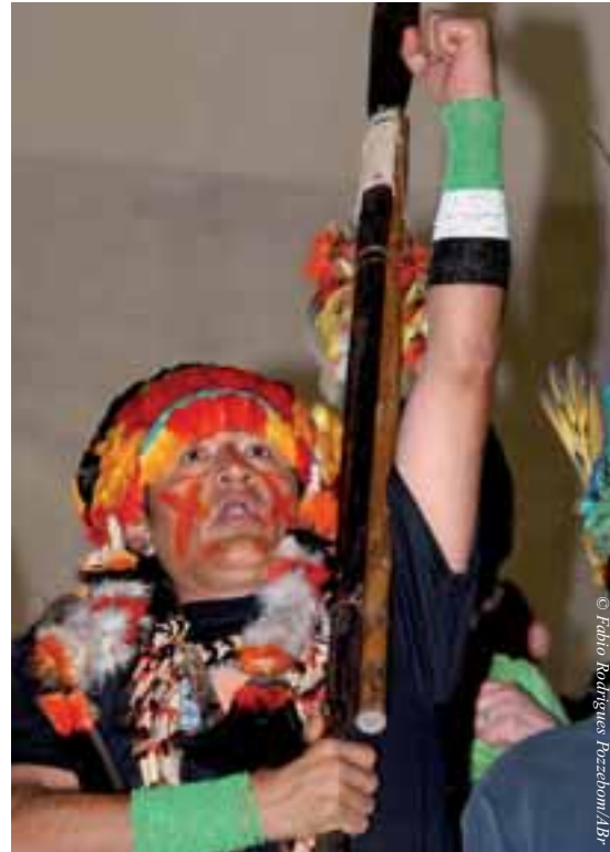
Belém - Índio durante evento paralelo ao Fórum Social Mundial (FSM) com os presidentes da Bolívia, Evo Morales, do Paraguai, Fernando Lugo, da Venezuela, Hugo Chavez, do Equador, Rafael Correa, para discutir a integração da América Latina

O FSM ressalta na Carta, em defesa do seu pluralismo de ideias, o seu aspecto não-partidário: “Não deverão participar do Fórum representações partidárias nem organiza-