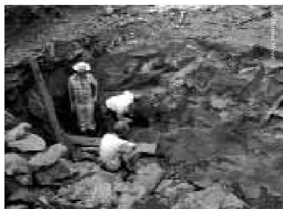
Amethyst Mine bei Plan Alto, Rio Grande do Sul