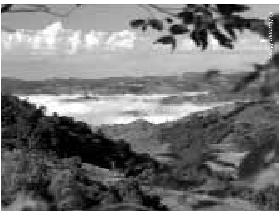
Landschaft bei Soledade, Rio Grande do Sul

Das Buch ist zu beziehen zum Preis von Euro 58,00 über den Buchhandel oder beim Wenzel Verlag, Am Krekel 47, D-Marburg/Lahn, Tel. 06421 173260 www.verlag-wenzel-druck.de wenzeldruck@t-online.de ISBN 3- 88293-136-1