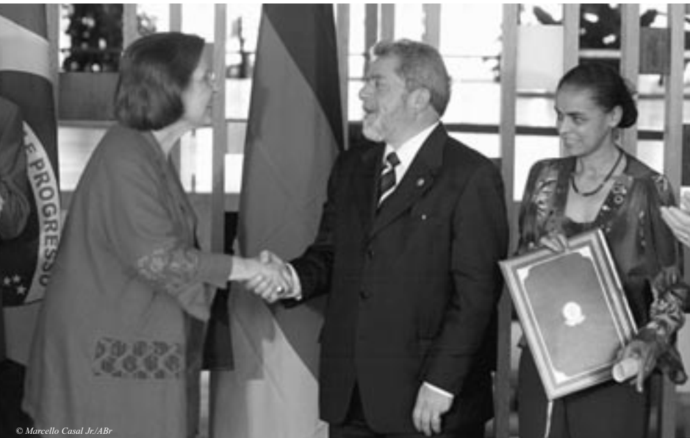
Wieczorek-Zeul traf sich mit Präsident Lula da Silva und Umweltministerin Marina Silva am 10. Juni 2003 in Brasília.