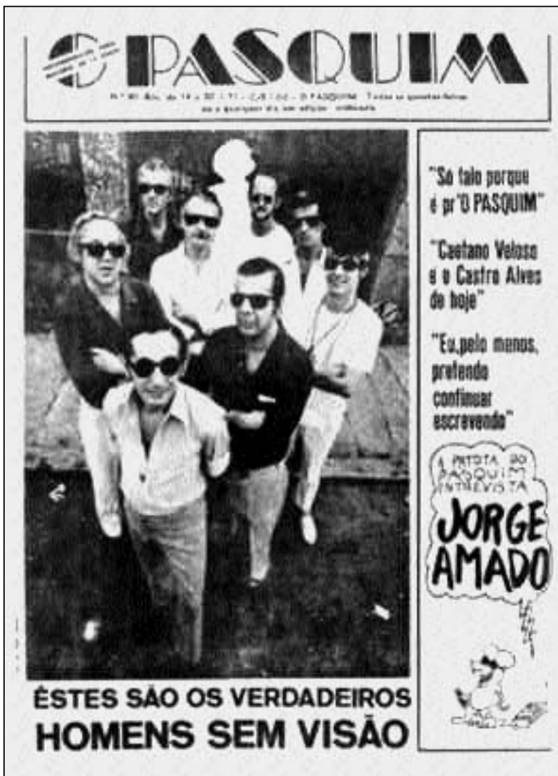
Nach ihrer Freilassung posieren die Redakteure als „tatsächliche Männer ohne Vision“ mit aufgemalten Sonnenbrillen.

Nach der Freilassung der Redakteure begann das jahrelange, zähe Armdrücken mit der Zensur. Alle Ausgaben mussten mit einer Vorlaufzeit von sieben Tagen in der zentralen Zensurstelle der Bundespolizei in Brasília eingereicht werden. Zurückerstattet wurden die Druckfahnen – oft mit beträchtlicher Verzögerung – teilweise bis zur Unkenntlichkeit gekürzt. Unüberwindbar