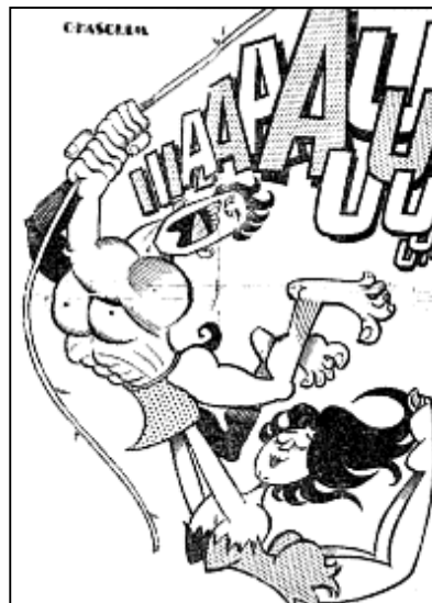
Tarzan- karikatur von Ziraldo

Wie in allen autoritären Regimes kam auch in Brasilien dem Lachen eine besondere Bedeutung zu. In seiner humoristischen Darstellung griff der Pasquim auf die bachtinschen Urmotive des Karnevals zurück, auf die Erniedrigung des Erhabenen, in den Cartoons vor allem durch die groteske Darstellung der „Akte des Körperdramas“, sprich die Verdauung, die Ausscheidung und das Erbrechen. Der Humorist Jaguar kreierte die Comicfigur „Gastão, o vomitador“ („Gastão, der Erbrecher“), dessen erster Auftritt darin bestand, sich – nomen est omen – über die Titelseite zu erbrechen. Durch seine Praxis des ständigen, unberechenbaren und scheinbar motivationslosen Sichübergebens manifestiert Gastão eine wahrhaftig starke Verachtung für alle Gepflogenheiten der bürgerli-