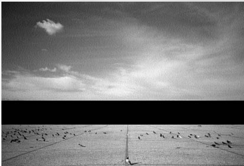
Clarissa Borges | Turista censurado/ fotográfica memória | Video, 2000