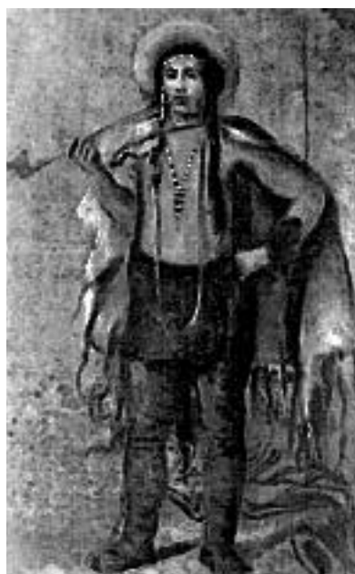
Tupuya-Indianer um 1638

Durch Neuregelung der Zins- und Steuerpolitik regte er zu Investitionen an. Werkzeug- und Waffenfabriken entstanden, Mühlen wurden technisch verbessert. Die landwirtschaftliche Produktion löste sich aus der verhängnisvollen Abhängigkeit von Monokulturen, verbreiterte die Produktpalette und erhöhte so die Exportchancen.