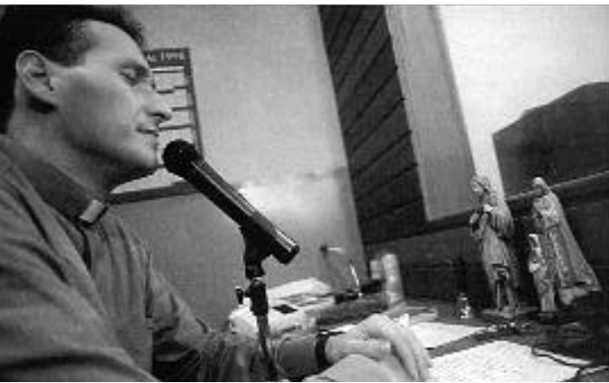
In Argentinien schloss soeben ein singender Priester mit Sony einen Plattenvertrag, um auch am Río de la Plata die Lieder des brasilianischen Paters Marcello Rossi in spanischer Version verbreiten zu dürfen.

men mit seinen Showgrößen oder Stars aus den Seifenopern auftreten zu lassen und damit für die Sache der römischen Kirche zu werben. Da die Showmessen eine große Aufmerksamkeit erreichen, können über Radio und vor allem Fernsehen ganz andere Ratings erreicht werden als im normalen Gottesdienst am Sonntag. Dabei besteht allerdings die Gefahr, dass es bei solchen Veranstaltungen letztlich nicht mehr um religiöse Inhalte oder die Verkündung des Wortes Gottes geht, sondern dass die Anziehungskraft des Showmasters, zu dem manche Priester geworden sind, im Mittelpunkt steht. Manche Beobachter befürchten schon, dass künftige Priester weniger am Studium theologischer Lehrsätze als vielmehr daran interessiert sein könnten, singen und tanzen zu lernen.