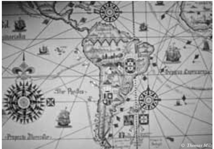
Portugiesische Atlantikkarte, ca. 1600, zu sehen im „Museu da Marinha“ im Stadtteil Belém in Lissabon.

Meist sind es tapfere Helden- taten, die zur Verewigung in den Geschichtsbüchern führen. Im Falle von Dom João VI, dem Prinzregenten des portugiesi- schen Weltreichs, war es die pure Angst, die ihn zu einer in der Weltge- schichte einmaligen Handlung veran- lasste.