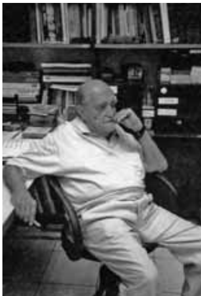
Niemeyer feierte im vergangenen Dezember seinen 100. Geburtstag

Tópicos dokumentiert hier eine Rede, die Oscar Niemeyer – der am 15. Dezember 2007 seinen hundertsten Geburtstag feierte – per Videobotschaft gehalten hat, als sein Projekt für ein Freizeitbad am 1. Juni 2005 in Potsdam präsentiert wurde. Das Projekt wurde längst verwässert. Was blieb ist diese Ode an den Beton. Vom Meister höchstpersönlich.