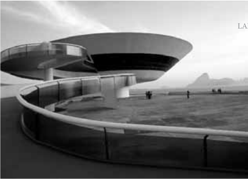
Das Museum für Gegenwarts-Kunst in Niterói: Kurvenreich

die bis zum zentralen Punkt führt. So hat dieses Projekt großes Interesse bei mir hervorgerufen, denn es hat ein ganz eigenes Erscheinungsbild.