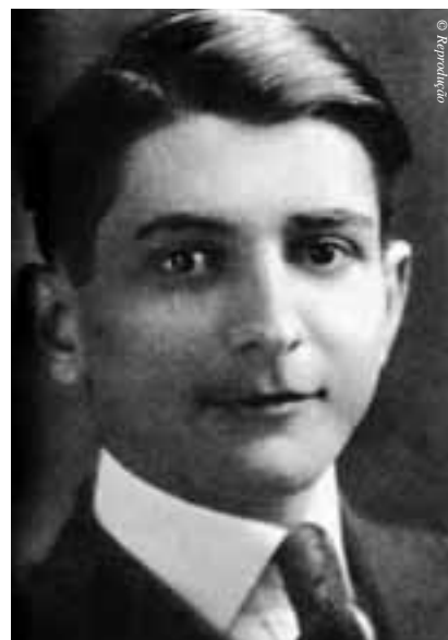
Gilberto Freyre quando jovem: nova biografia detalha anos de formação intelectual do autor

Os anos 20 eram de muitas mudanças no mundo. Mudanças que afetaram profundamente o jovem brasileiro dos trópicos, mas nunca abalaram sua fé na tradição. A biografia cultural de Freyre percorre todas essas transformações, os passos de Freyre pela América do Norte e pelo Velho Mundo. Do estrangeiro, Freyre escrevia suas impressões para o “Diário de Pernambuco”: relatos repletos de interpretações, quase todas comparativas. Escrevia aos amigos brasileiros - Oliveira Lima, Manuel Bandeira e José Lins do Rego, principalmente. Sempre se referia a Franz Boas, um dos seus mais influentes professores. “Apesar do horizonte científico de seu projeto e da aparência positivista de suas pesquisas, repletas de detalhes e descrições precisas de objetivos, a perspectiva de Boas situa-se no contexto cultural da época e no âmbito de uma sensibilidade moderna com a qual Freyre tem fortes elos”, dizem os autores, apontando que no estilo do alquimista nietzschiano, capaz de descobrir ouro nos materiais mais abjetos, Freyre ausculta a escravidão para nela encontrar a singularidade humana: