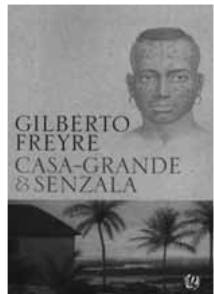
Capa da obra-prima

Até hoje “Casa-Grande & Senzala” é um dos livros basilares do Brasil, com seus temas característicos da nossa formação - “a moura encantada, o caráter feudal da colonização, a avaliação positiva do esforço do colonizador, a importância do açúcar, a influência dos jesuítas e a atenção para as relações sociais”. Para entendermos melhor a extensa obra de Gilberto Freyre, principalmente “Casa-Grande”, a atual biografia é um prato cheio. Fácil de ler, sem ranço acadêmico, o livro passeia tanto pelo homem - Gilberto Freyre -, quanto por seus mestres e suas obras. ■